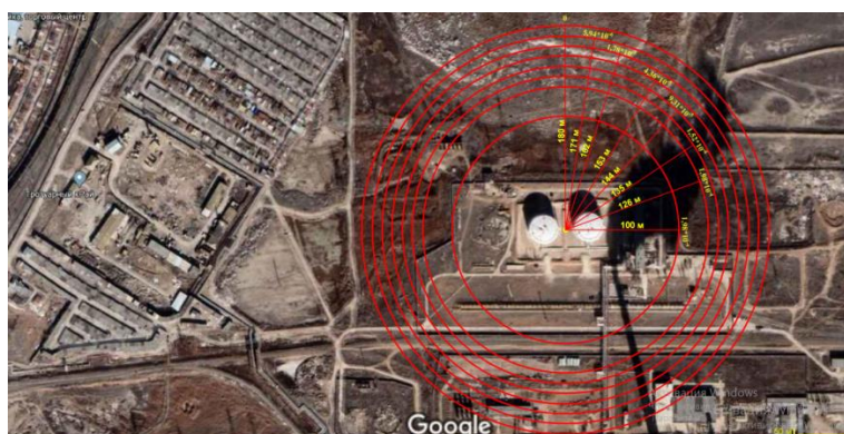
Рис. 4. Поля распределения индивидуального риска для нефтебазы

Изменение значений индивидуального риска R_j по зонам удобно наглядно представить графически в виде полей распределения индивидуального риска на карте местности, представляющей территорию нефтебазы и прилегающую к ней территорию. Поля распределения индивидуального риска показаны на рис. 4.