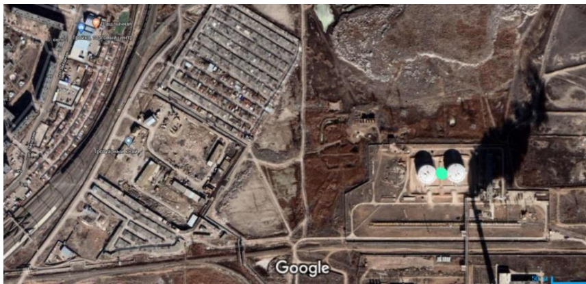
Рис. 1. Территориальное расположение нефтебазы

Чтобы оценить, насколько опасно воспламенение пролива нефти на рассматриваемом объекте для человека, в работе выполнены расчет, оценка и распределение риска, возникающего в связи с аварийным проливом нефти.