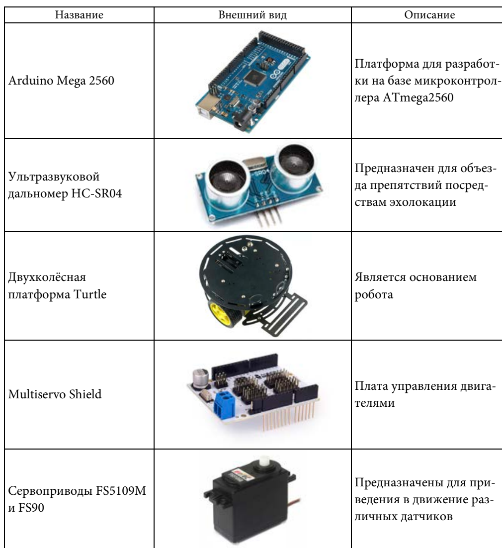
Основные элементы сервисного робота

Заключение. В разрабатываемой роботизированной системе реализованы следующие функции: перемещение по прямой линии, объезд препятствий посредством информации с ультразвукового дальномера, голосовое управление, механизм выдачи лекарственных препаратов с использованием RFID.